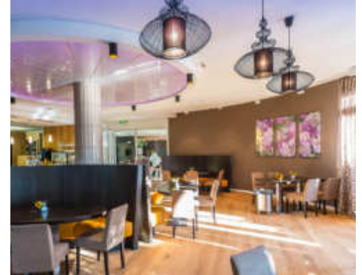
Das Schwarzwald-Café lädt zum Besuchen ein.