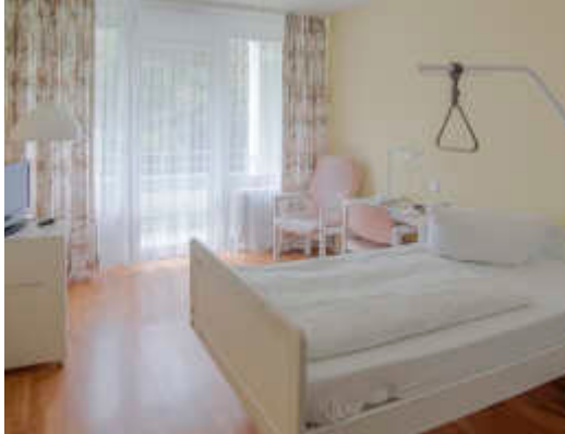
In unseren hellen Zimmern werden Sie sich wohlfühlen.